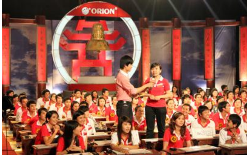
MC trò chuyện cùng thí sinh

Được sự đồng ý của Ban Giám hiệu Nhà trường, tối ngày 20/03/2010, sinh viên Đại học Duy Tân đã tham gia cuộc thi “Rung chuông vàng” do VTV3 tổ chức tại Trung tâm giáo dục thể chất, ĐH Bách Khoa-Đà Nẵng.