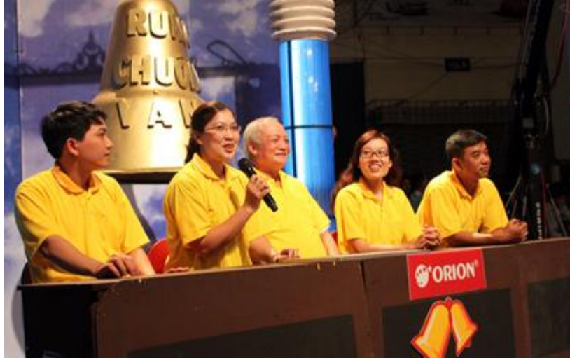
Thầy cô tham gia cứu trợ cho các thí sinh

Chương trình diễn ra thật sự gay cấn, 6 câu hỏi đầu tiên thật sự không gây khó khăn lắm cho các bạn thí sinh, nhưng sau câu thứ 7, 8 thì số lượng thí sinh trên sàn đấu bắt đầu thưa thớt dần và tình thế bắt buộc đến câu thứ 10 các thầy cô phải ra tay cứu trợ. Phần cứu trợ của thầy cô giáo đã tiếp thêm sức mạnh và sự phấn khởi cho các thí sinh, hội thi như vỡ òa lên bởi những tiếng hò reo của cổ động viên và thí sinh dự thi. Với sự nỗ lực, cố gắng hết mình, thành tích thật tuyệt vời, quý thầy cô giáo đã cứu được toàn bộ thí sinh trở lại sàn thi đấu ngay khi bắt đầu câu hỏi thứ 11.